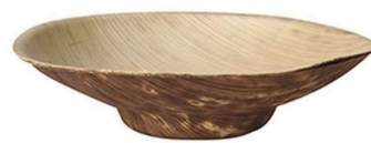
Bol bamboo Ref. xxxxx