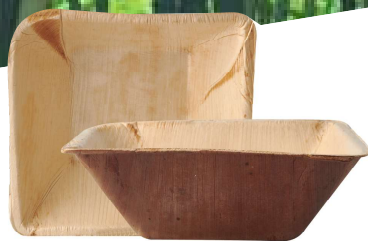
Bol bamboo Ref. xxxxx