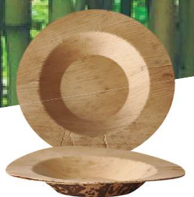
Plato bamboo Ref. xxxxx