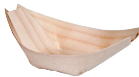
fingerfood bamboo Ref. xxxxx